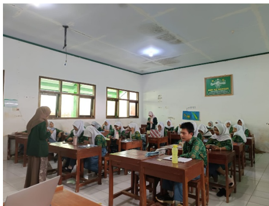
Gambar 2. Pembagian soal Pre-test

Kegiatan pengabdian dilaksanakan secara luring selama 1 jam 30 menit dengan pendekatan sosialisasi, edukasi, dan diskusi partisipatif. Hal pertama difokuskan pada pengenalan tim pengabdian dengan siswa-siswi kelas X Akuntansi 1 maupun sebaliknya yang bertujuan untuk mencairkan suasana kelas. Sebelum pemaparan materi, tim pengabdian memberikan soal pre-test melalui barcode yang dapat discan juga pembagian link pre-test melalui ketua kelas untuk mengurangi resiko kendala pengisian link tersebut. Soal pre-test menggunakan google form yang menggali pengetahuan dan kebiasaan siswa-siswi dalam menerapkan gaya hidup halal.