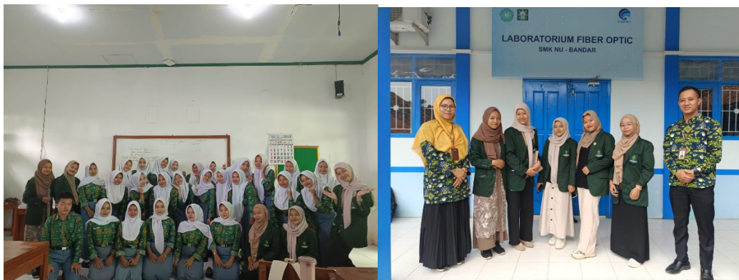
Gambar 4. Sesi Dokumentasi

Setelah selesai kegiatan pengabdian diakhiri dengan pembagian tanda ucapan terima kasih dan sesi foto bersama kepada Siswa-siswi SMK NU Bandar serta dewan guru