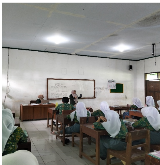
Gambar 3. Pemaparan materi oleh tim pengabdian

Kemudian dilanjutkan dengan pemaparan materi, yaitu gaya hidup yang halal, Materi membahas mengenai prinsip dan aturan Islam dalam memperhatikan aspek halal dalam kegiatan konsumsi, juga memotivasi siswa untuk menerapkan gaya hidup halal melalui strategi peningkatan kesadaran siswa tentang kewajiban mengimplementasikan aturan Islam sebagai bentuk ketaatan kepada Allah SWT serta mengajak siswa mengevaluasi perilaku yang biasa dilakukan dalam pemilihan dan pembelian produk kebutuhannya. Penyampain materi bersifat interaktif seperti ceramah, diskusi, dan tanya jawab mengenai materi.