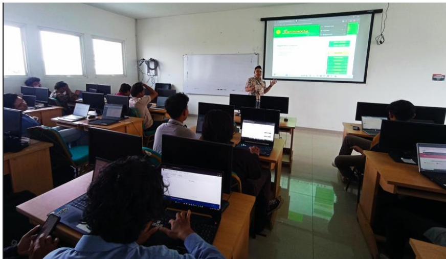
Gambar 2. Pelatihan submit artikel di OJS

Kegiatan pelaksanaan pengabdian dibagi dalam tiga sesi utama, yaitu sosialisasi, edukasi teknis, dan seminar tematik. Setiap sesi dilaksanakan dengan pendekatan partisipatif untuk mendorong keterlibatan aktif mahasiswa.